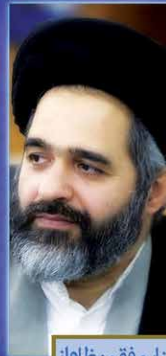
حجت‌الاسلام والمسلمین، دکتر احمد ایزده

روش‌شناسی فقه نظام‌از منظر امام خمینی (ره)